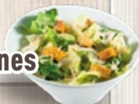
Tilapia en Salsa de Camarones

Sopa con trozos de salmón y camarones acompañada de arroz blanco y aguacate.