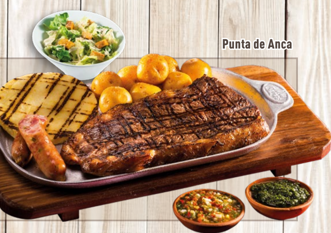
Punta de Anca