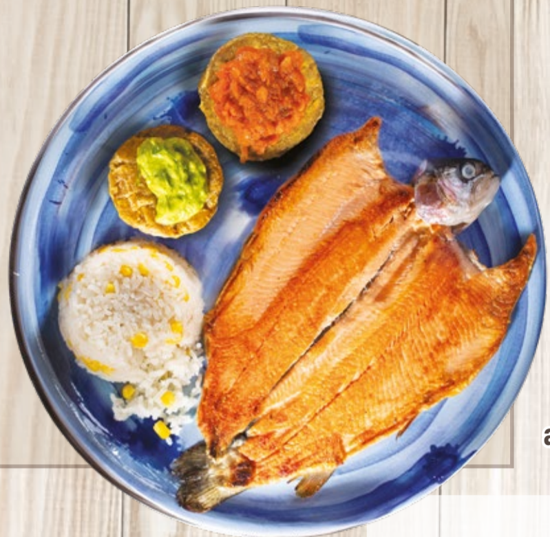
Trucha a la Parrilla