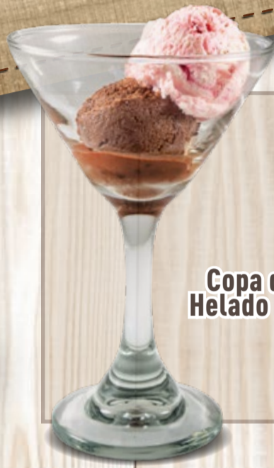
Copa de Helado

Sabores: Caramelo, oreo, frutos rojos, Chocolate, maracuyá o mandarina.