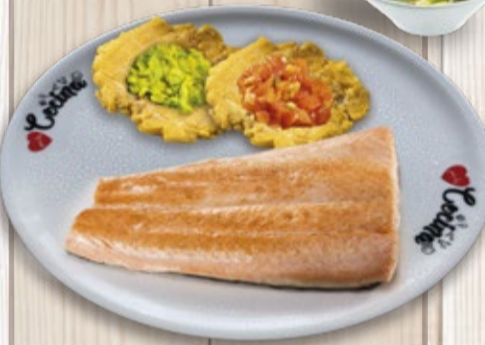
Cazuela de Salmón