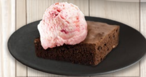
Brownie con Helado

*El brownie con helado y las malteadas estan sujetos a disponibilidad en el punto de Venta.