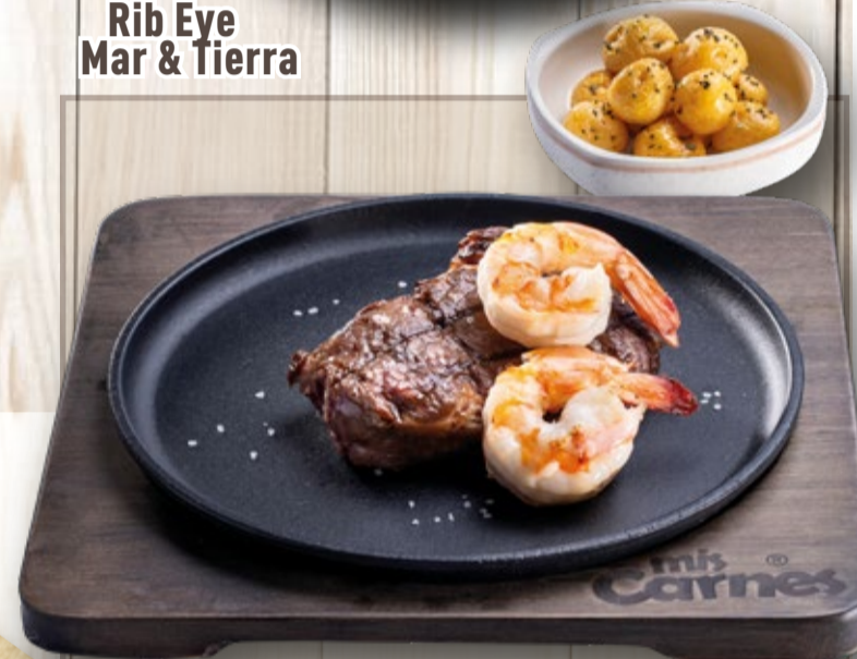
Rib Eye Mar & Tierra